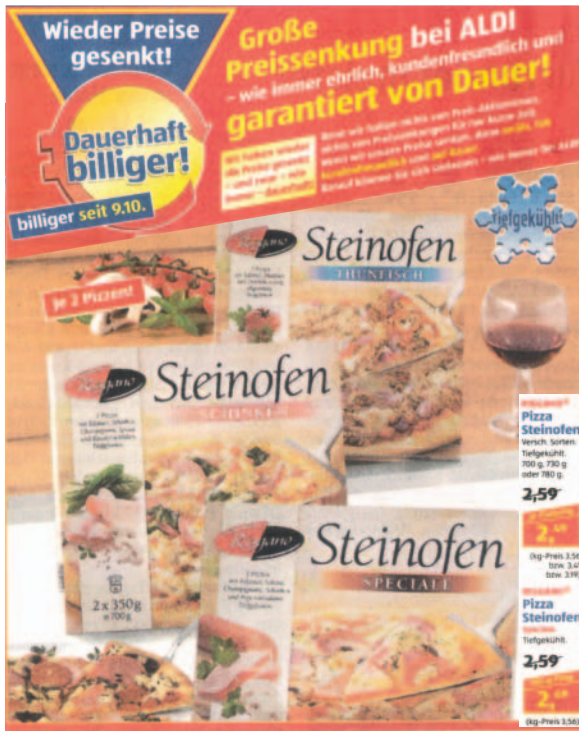
Aldi-Anzeige vom 11.10.10 im Main-Echo.